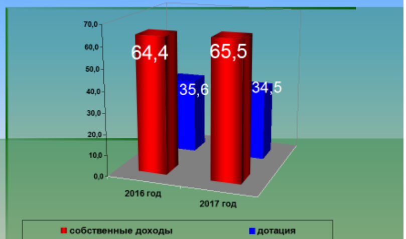
Структура доходов городского бюджета в динамике за 2016-2017 гг.

Доля налоговых доходов в собственных доходах городского бюджета составила 89,4%, темп роста в динамике – 111,4%.