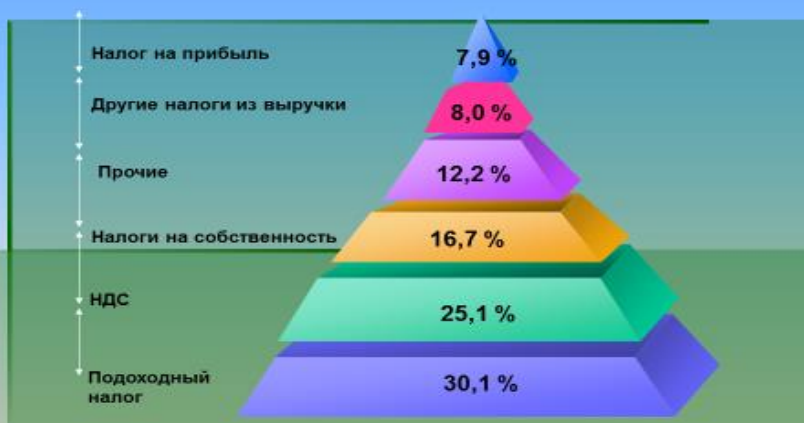
Структура налоговых доходов за 2017 год

Основными налоговыми источниками, сформировавшими доходную часть городского бюджета, являются: подоходный налог, налог на добавленную стоимость, налоги на собственность, НДС, налог на прибыль и проч.