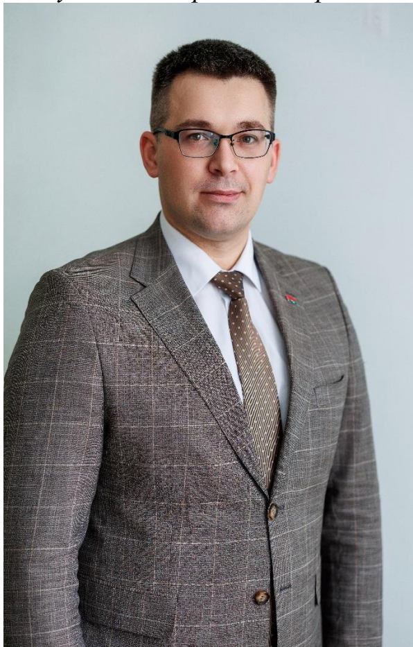
Клімук Уладзімір Уладзіміравіч